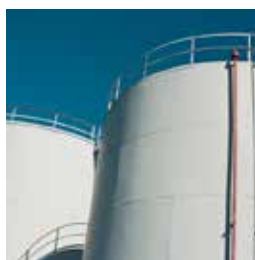
Cuves et réservoirs industriels